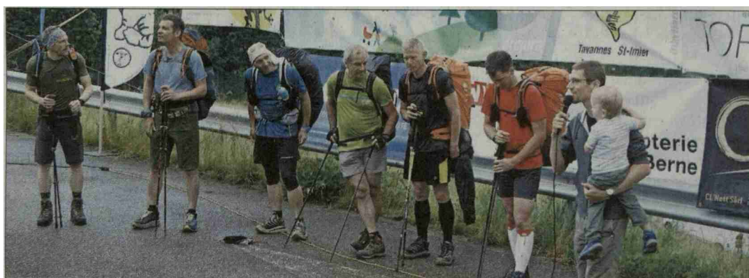
Parapente au dos , bâtons de marche en mains, les premiers coureurs-pilotes se sont élancés hier de Moutier.

Les premiers départs de la 5 e Jura'ltitude XC, course alliant marche et vol en parapente , ont été donnés hier matin à Moutier. Équipement au dos, les participants de la catégorie Adventure, course d'orientation se déroulant sur quatre jours, se sont en effet élancés sur le coup des 8 h, depuis la patinoire. Ces six parapentistes et marcheurs chevronnés devront passer par une vingtaine de pointages disséminés dans un espace de 820 km 2 , entre Oensingen (SO), Tête-de-Ran (NE), Boécourt et La Pierreberg (JU, à la frontière avec Bâle). «La météo instable